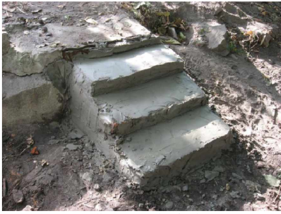
...die Treppe ist fertig...