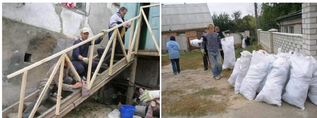
.....Geländer schleifen und streichen.....