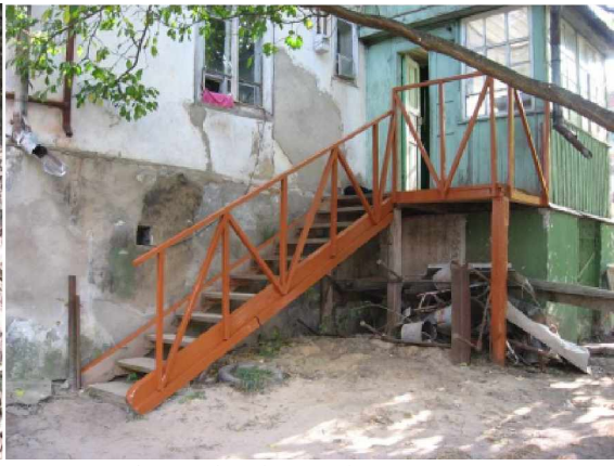
...das Gelände auch!

Der letzte Besuch führt uns noch zu einem Mann mit Elektrorollstuhl . Leider waren die Akku´s zu alt und ließen sich nicht mehr laden. Wir konnten ihm zwei neue Akku´s kaufen und schon funktioniert alles wieder. Der Mann war sehr glücklich.