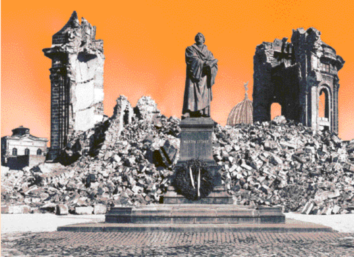
Lutherdenkmal vor der Ruine der inzwischen wieder- aufgebauten Frauenkirche Dresden